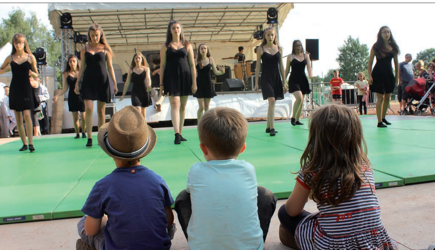
Démonstrations sportives de la Saint-Jean

Quelle belle fête ! Chaque année la Municipalité aime à rassembler petits et grands, voisins et voisines, ami-e-s et familles au stade municipal pour l'incontournable fête du village.