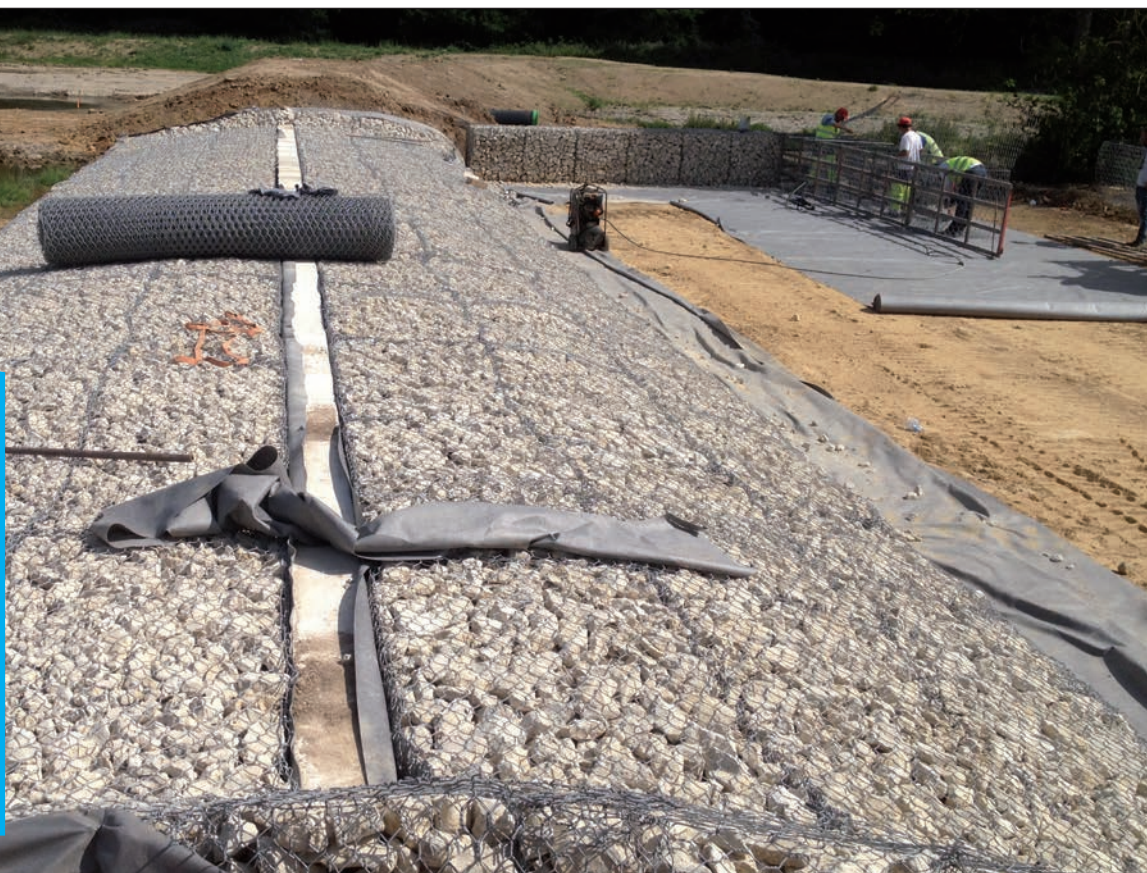
Ouvrage du Pivot

“Avec ces cinq ouvrages déjà réalisés, le risque d’inondation a ainsi fortement reculé pour l’ensemble des habitants du bassin-versant.”