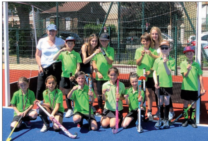
Match de démonstration au village olympique à Paris, en juin 2017.

L'équipe Dames a raflé le championnat Île-de-France