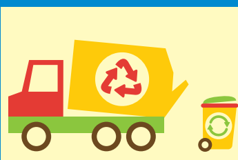
Fusion du Sictom et du Siredom