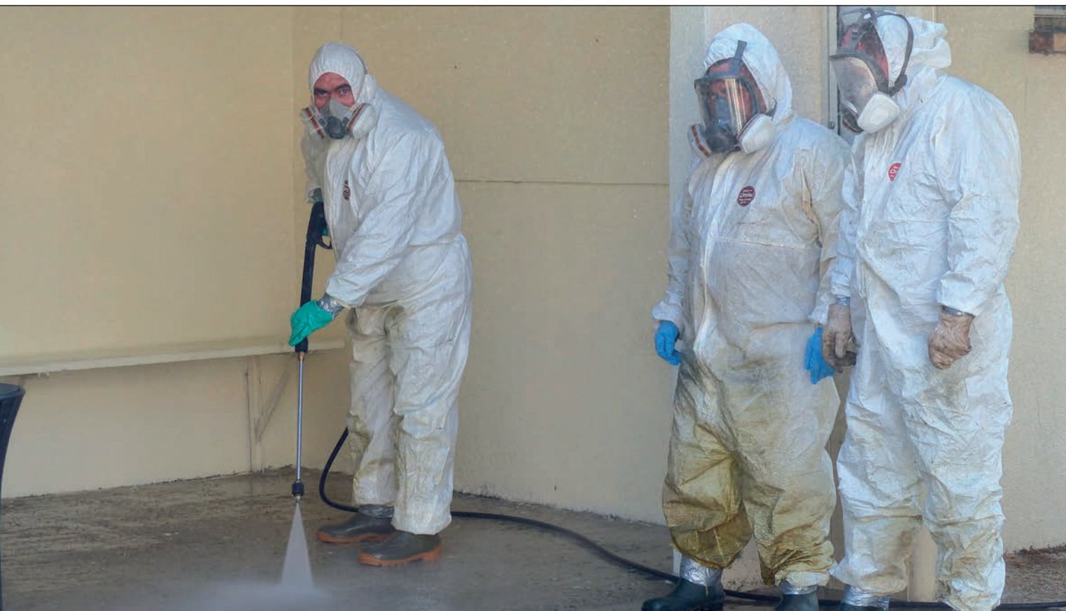
Nettoyage de l'abri-bus rue Fontaine de Ville par les Services techniques municipaux.

L'entretien des bâtiments municipaux est l'une des activités permanentes des services techniques. Les petites interventions se font au jour le jour, en fonction des disponibilités et des compétences des différents agents. Mais les périodes de congés scolaires permettent d'entreprendre des opérations plus importantes.