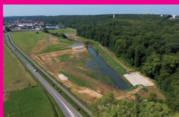
L'ouvrage du Pivot... ça marche !