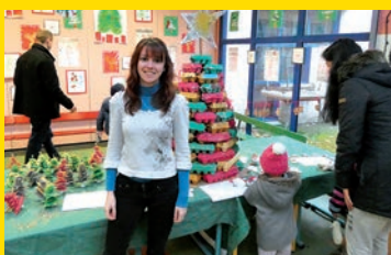
Des nouvelles des écoles primaires