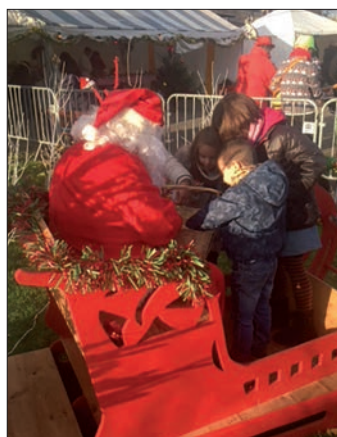
Photo de couverture : Le Père Noël en visite au Marché de Noël de Briis

Le premier samedi matin de chaque mois de 9 h à 12 h. Inscription préalable obligatoire en Mairie.