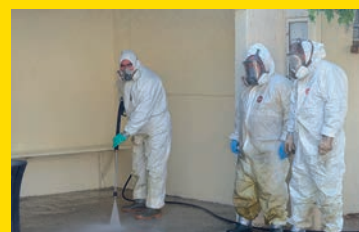
Embellissement et entretien des espaces publics