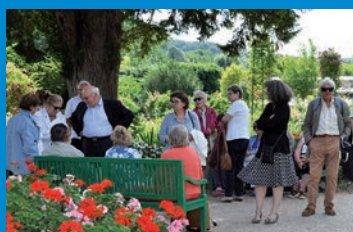
Sortie de Printemps 2018