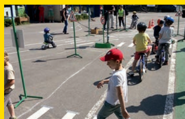
Tous en selle, ça roule dans les cours !