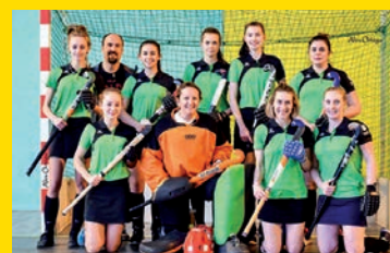
Des associations sportives dynamiques, une fierté de notre territoire