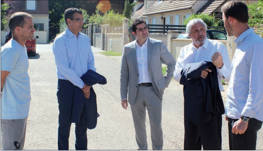
Le 27 juin dernier, le sous-préfet, le Maire de Briis et le Président du SIHA avec les habitants dans les quartiers inondés.

Le mois de juin 2018 restera dans les annales de la commune comme celui de la dernière pluie centennale. “Un épisode orageux sans précédent, de type tropical” . Ce sont les mots que Monsieur Abdel-Kader Guerza, sous-préfet de Palaiseau, a employé pour décrire l'orage du 12 juin dernier lors sa visite dans les jours qui ont suivis les inondations.