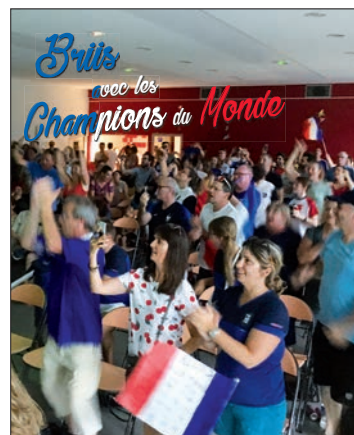
Photo de couverture : Retransmission sur écran géant de la finale de la Coupe du Monde 2018 dans la salle communale le 15 juillet 2018.

Le premier samedi matin de chaque mois de 9h à 12h. Inscription préalable obligatoire en mairie.