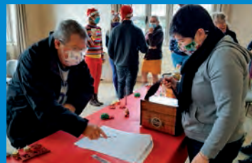
Des colis de fête qui réchauffent le cœur des aînés.es