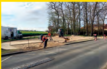
Le transport scolaire va reprendre à Frileuse