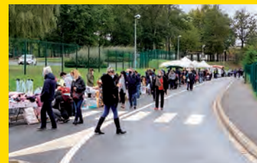
Une brocante pour vendre, acheter et se retrouver...