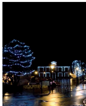
Photo de couverture : Illuminations 2020 sur la place de la Libération.

Le premier samedi matin de chaque mois de 9 h à 12 h. Inscription préalable obligatoire en mairie.