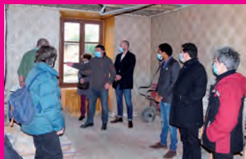
Six nouveaux logements rue de l'Orme Maillard