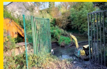
Qui gère l'entretien des mares et des cours d'eau ?