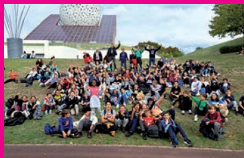
Séjour d'intégration Futuroctobre 2023 pour les collégiens