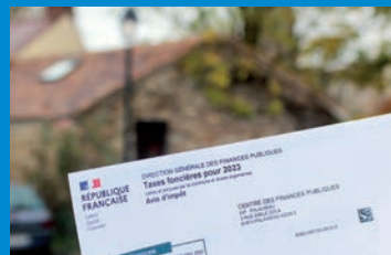
Comprendre la taxe foncière