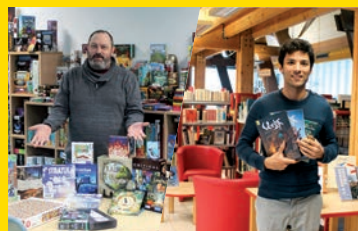
La culture, au cœur des services municipaux