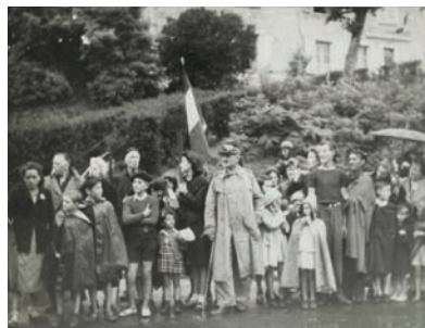
Photo présentée comme "Le général Leclerc entouré d'une foule de civils, près de la mairie de Briis-sous-Forges le matin du 24 août 1944". Si vous reconnaissez l'endroit, contactez nous : lesavb91@gmail.com

du financement de la borne : Crédit Agricole, Souvenir Français, Amicale des Anciens Combattants (Fontenay-lès-Briis) et les donateurs de l'association. Venez partager ce moment commémorant la libération de Briis de l'occupation allemande.